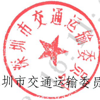
深圳市交通运输委员会