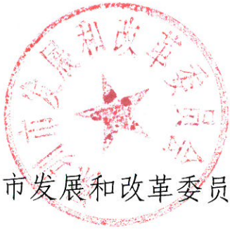
深圳市发展和改革委员会