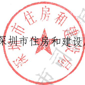
深圳市住房和建设局