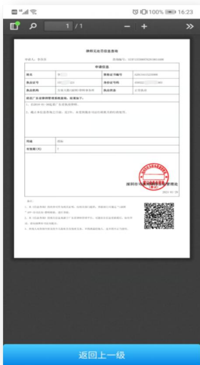
1、在线查看证明文件信息