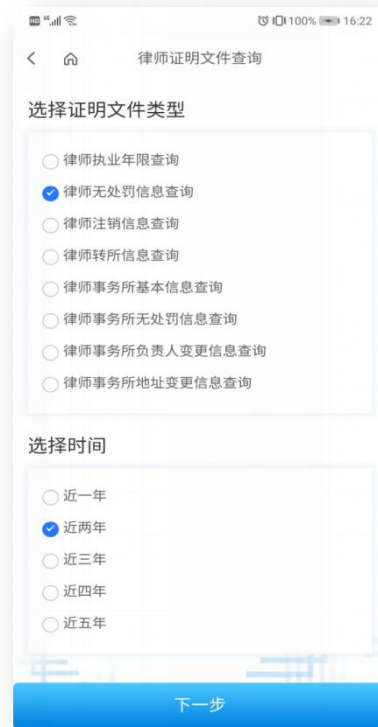
3、选择证明文件类型及查询年限