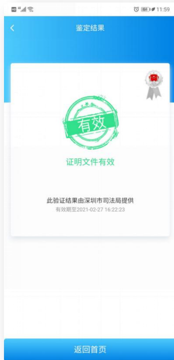
2、查看文件有效性验证结果