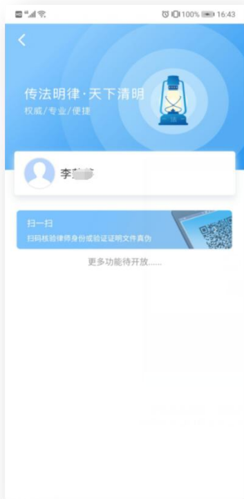
1、用证单位通过“i深圳”律师核验入口扫描文件二维码