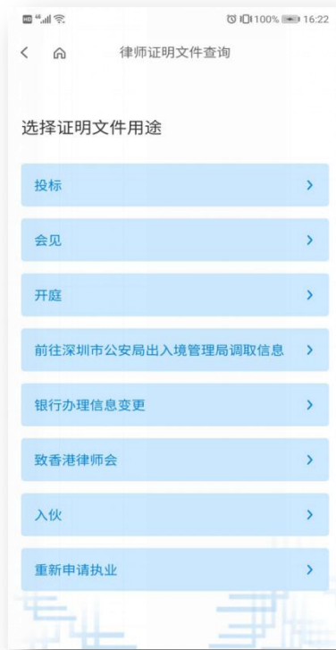
2、选择证明文件用途