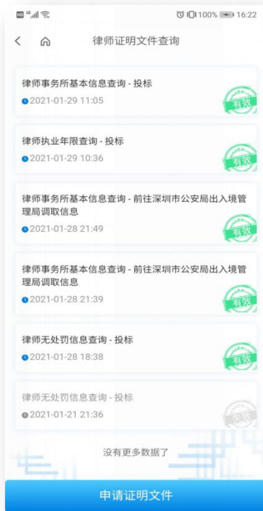
1、点击申请证明文件